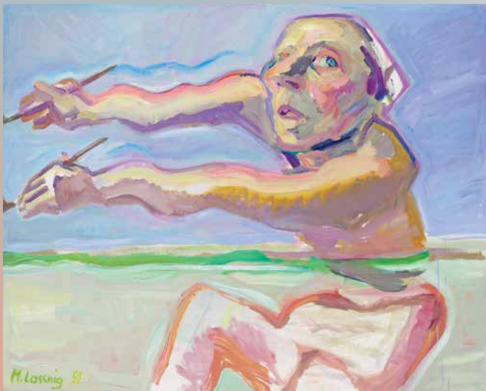
Maria Lassnig, Ellige Oberwassermalerei / Simultanmalerei / Malen mit 2 Händen , 1991 (Naglo slikanje na vodi / Simultano slikanje / Slikanje z dvema rokama; Hurried Painting on Water / Simultaneous Painting / Painting with 2 Hands )